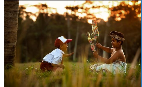
Persatuan Indonesia dengan mencintai dan menghormati keberagaman budaya di Indonesia.