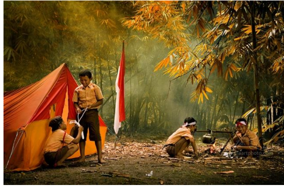
Pramuka dapat mengajarkan dan mengimplementasikan nilai-nilai Pancasila .