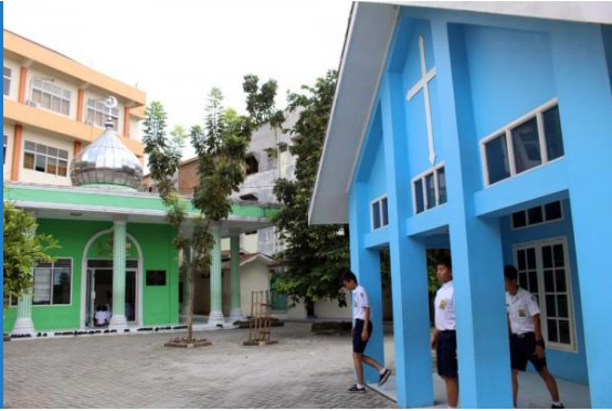
Menghargai keberagaman di sekolah (Yayasan Sultan Iskandar Muda, Medan)