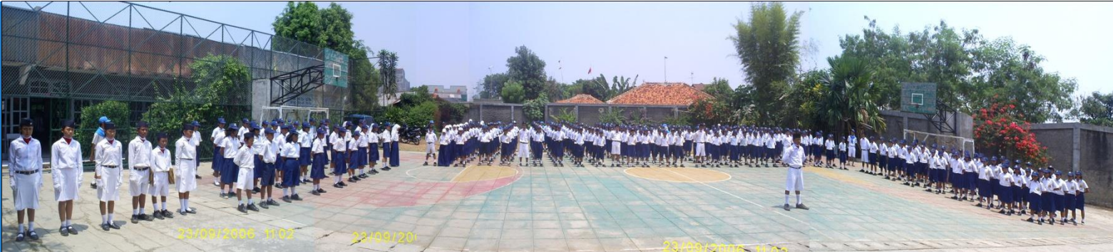
Upacara bendera setiap hari Senin di sekolah menjadi salah satu aktualisasi nilai-nilai Pancasila . 9